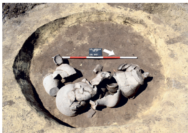
Obr. 4. Čejč. Depot keramických nádob z mladší doby bronzové. Fig. 4. Čejč. A hoard of ceramic vessels from the Late Bronze Age.