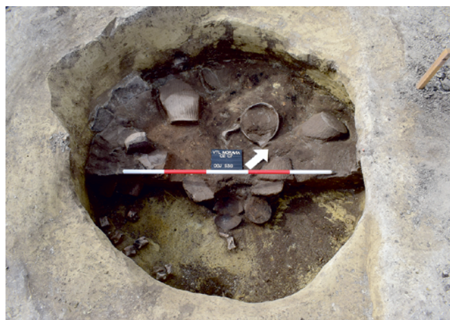
Obr. 3. Čejč. Zásobní jáma z mladší doby bronzové s kumulací keramiky. Fig. 3. Čejč. Storage pit from the Late Bronze Age with pottery finds.