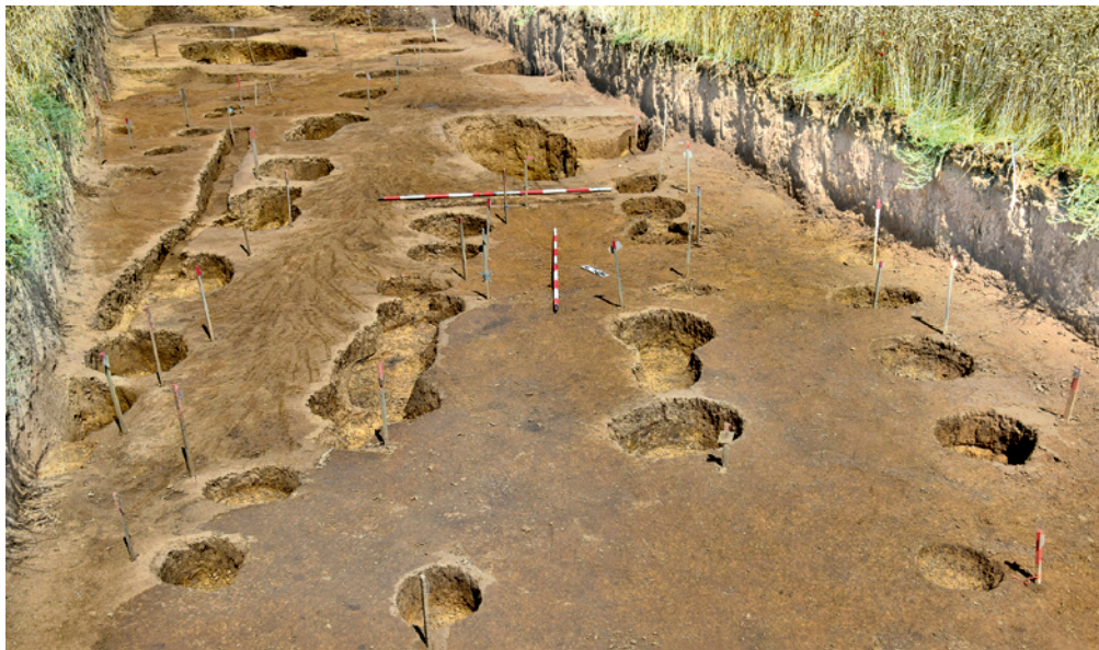
Obr. 20. Olomouc-Slavonín. Půdorys dlouhého domu kultury s lineární keramikou.