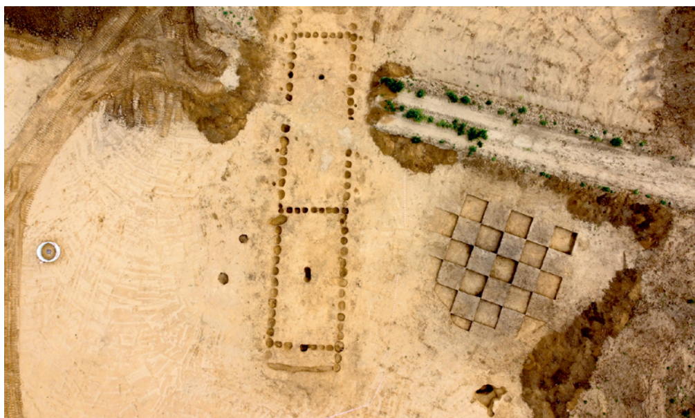
Obr. 18. Nedakonice. Letecký snímek půdorysu domu.

V rámci terénní prospekce uskutečněné dne 18. 11. 2021 a zaměřené primárně na ověření přítomnosti raně středověké železářské produkce na katastru obce Obora, byla v trati „Sedliska“ získána i menší kolekce neolitické štípané industrie. Soubor sestává ze čtyř artefaktů, přičemž ve všech případech jde