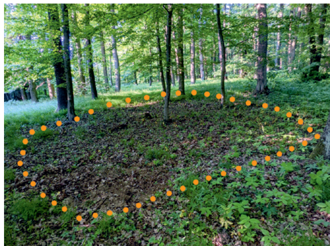
Obr. 17. Mouřínov. Objekt vymezený změnou bylinného patra. Foto E. Urban.

Fig. 16. Mouřínov. Location of the site on the Lidar terrain image. A – “Prostřední vrch”, B – “U Široké cesty”. Author E. Urban.