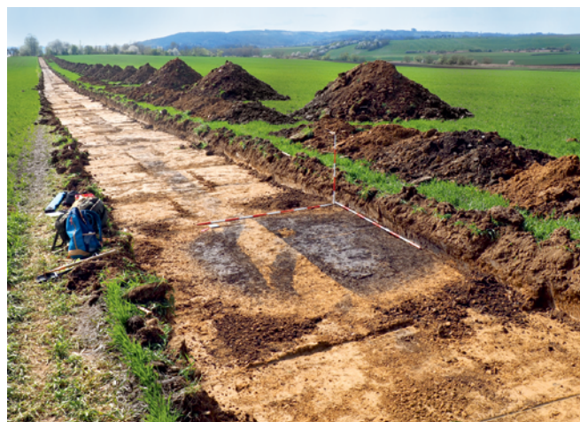
Obr. 13. Lysice. Pohled na liniovou skrývku a začištěný objekt 516.

Bartík, J. 2020: Příchod zemědělců. In: M. Novák (ed.): Blanensko a Moravský kras v pravěku . Blansko: Muzeum Blanenska, p. o., 57–89.