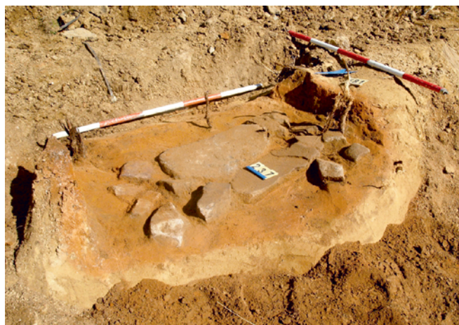
Obr. 3. Brno – Starý Lískovec. Neolitická pec.

Fig. 3. Brno – Starý Lískovec. Neolithic kiln.