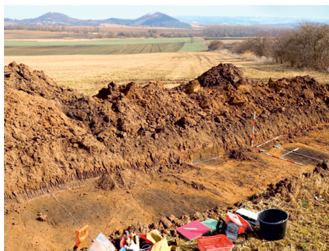
Obr. 5. Býkovice. Pohled na začištěné objekty v líniovém výkopu. V pozadí kopce Velký a Malý Chlum.

Štrof, A. 1985: Übersicht neuer Lokalitäten und Funde in der Boskoviccer Furche (Bez. Blansko). Přehled výzkumů 1983 , 91–98.