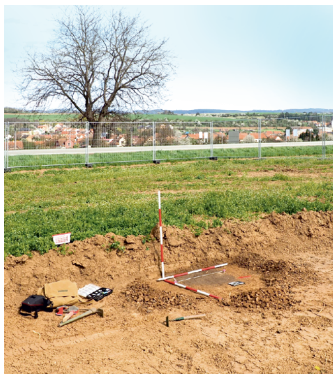
Obr. 2. Bořitov. Pohled na začištěný objekt 514, v pozadí obec Bořitov. Fig. 2. Bořitov. View of the cleaned Feature 514 with Bořitov in the background.

Na katastru Bořitova byl 4. května 2021 prozkoumán archeologický objekt (obj. 514) situovaný ve východním rohu parcely č. 2259 nacházející se v blízkosti silnice č. 43 (obr. 2). Jednalo se o mělce zahluobený objekt kruhového tvaru o průměru 0,7 m s podhloubenými stěnami o průměru 0,9 m. Dochovaná hloubka objektu činila 0,3 m. Tmavá výplň objektu se vyrýsovala v hloubce 0,45 m pod ornici a obsahovala ojediněle drobné úlomky pravěké keramiky (snad neolitické), dále malé uhlíky a rozpadající se mazanici. Objekt ležící v nadmořské výšce 326 m