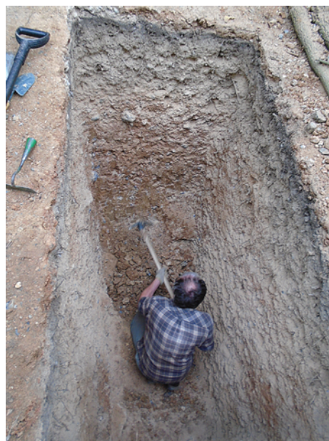
Obr. 22. Moravský Krumlov – Krumlovský les. Záběr z výzkumu.

Oliva, M. 2020: Krumlovský les II-east: Recent excavations of the Mesolithic mining area. Acta Musei Moraviae, scientiae sociales CV(2), 167–179.