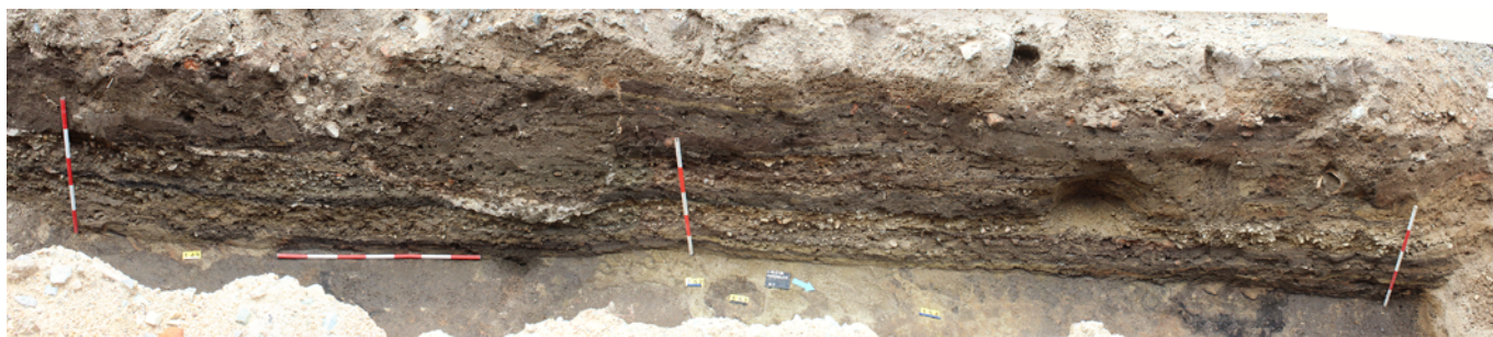
Obr. 90. Pohořelice. Profil R5 s dochovanou stratigrafií od vrcholného středověku do současnosti.