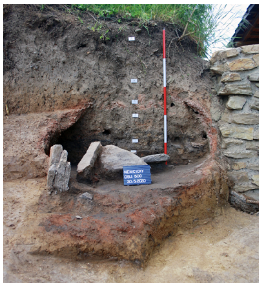
Obr. 79. Němčičky. Profil pece.

Zjištěná situace navazuje na výzkum Jihomoravského muzea ve Znojmě, p. o., z prosince roku 2000 (Berkovec 2001). Ten na