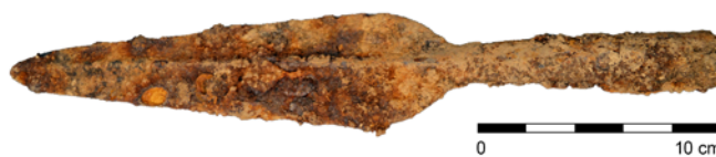
Obr. 78. Moravské Knínice. Železné kopí.

V dubnu roku 2020 náhodně nalezl A. Romanovský v lesním terénu asi 150 metrů severovýchodně od vrcholu „U Tří Rumunů“ (404,7 m n. m.) železný hrot kopí (obr. 78). Místo nálezu je situováno v nadmořské výšce okolo 388 m, v horní partii severovýchodního svahu, který klesá k levému břehu Kuřimky. Jedná se o kompletní železný hrot kopí o celkové délce 306 mm. Dlouhá listovitá čepel s maximální šířkou ve spodní části je zakončena lehce zkoseným hrotem. Střed čepele je zpevněn podélným žebrem, které přechází v dlouhou, mírně se rozšiřující tulej kruhového průřezu. Formálně odpovídá kopím typu IIIb podle A. Ruttkaye (1976, 300–301, Abb. 36), jejichž bližší časové zařazení je však obtížné, neboť se jedná o tvar, jenž se udržuje od doby železné až do konce středověku. Předmět by mohl souviset s lokalitou v trati „Poloudělí“, vzdálenou