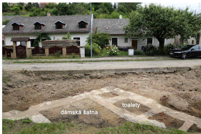
Obr. 69. Jihlava. Pohled jižním směrem na zvýrazněné základové zdivo pavilónu.