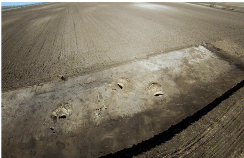
Obr. 66. Hustopeče. Východní část zkoumané lokality, snímek z kvadrokoptéry, pohled od východu.