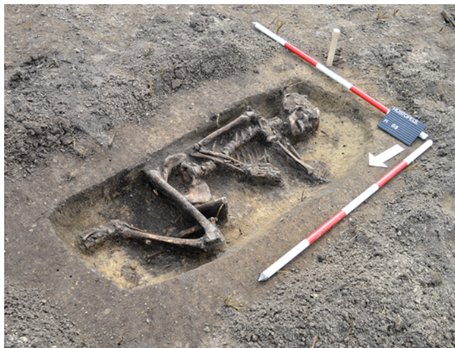
Obr. 67. Hustopeče. Hrob H811.

Čerňavová, K. 2020: Optická přístupová síť Budkovice (Ivančice, okr. Brno-venkov) . Rkp. nálezové zprávy, č. j. 40/2019. Uloženo: archiv Moravského zemského muzea.