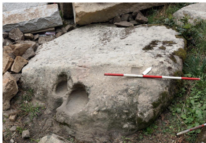
Obr. 62. Hrad Roštejn. Kulevé jamy vytesané do skalního podloží.

Vaničková, Z., Jaroš, Z. 2006: Z historie hradu Roštejna . Interní tisk. Uloženo: Muzeum Vysočiny Jihlava.