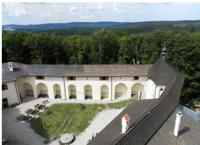
Obr. 59. Hrad Roštejn. Pohled z věže.