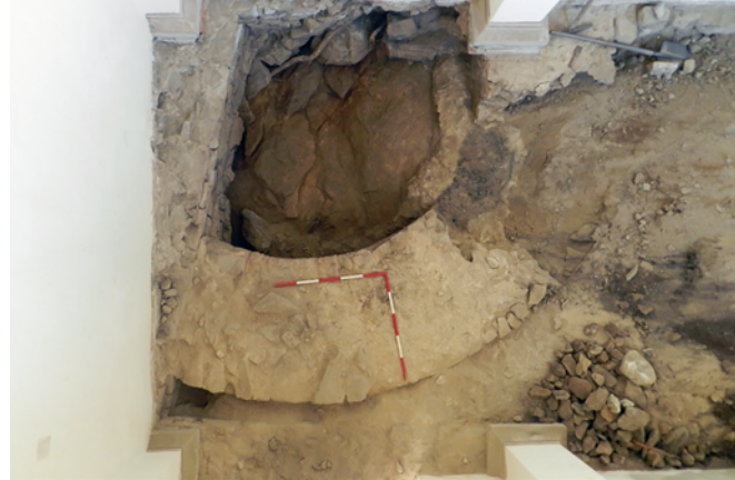
Obr. 60. Hrad Roštejn. Severozápadní nároží fortifikace s věží a kaplí sv. Eustacha.