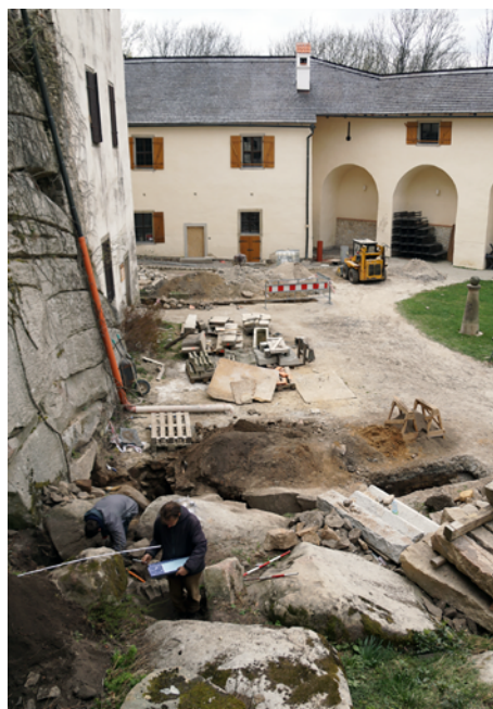
Obr. 61. Hrad Roštejn. Severovýchodní část nádvoří.