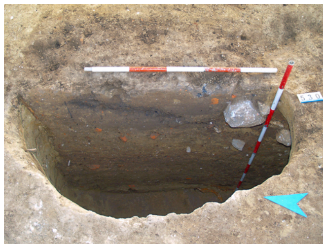
Obr. 52. Brno, Židenice. Nejjednodušší typ lochu.

Pozoruhodným fenoménem je přítomnost pěti lochů. Nacházely se v severní části plochy při Vančurově ulici. Lze mezi nimi rozlišit tři typy. Nejjednodušší představovala prostá oválná jáma se svislými stěnami dosahující délky 2,6 m (podhloubená část byla dlouhá 1,2 m), do níž se vcházelo oválným vstupem po žebříku (obr. 52). Druhý typ byl zastoupený třikrát – jednalo se o loch, který měl schody vytesány do podloží (obr. 53). V jednom případě schody ústily do poměrně malé oválné prostory o rozměrech cca 1,8 × 1 m se svažujícím se stropem o výšce 50 až 70 cm. Druhý loch byl o něco větší – skladovací prostory přibližně oválného tvaru o délce cca 2,2 × 1,8 m; strop zjištěn nebyl. Třetí loch tohoto typu byl poněkud odlišný. První zjištěný schod ústil na podestu, ke které byl v pravém úhlu připojen malý skladovací prostor oválného tvaru 1,2 × 1 m se stropem ve výšce 90 cm. Poslední loch má dvě fáze – starší odpovídá předchozímu typu lochu se schody vyhloubenými do podloží. V mladší fázi, poté co byly tyto schody ošlapány, bylo vybudováno nové schodiště z nepálených cihel – kotovic (obr. 54). Jednotlivé stupně byly zpevněny dřevěnými prahy, které byly zapuštěny do kapes ve stěně lochu a zpevněny zlomky cihel v těchto kapsách. Samotný skladovací prostor měl přibližně obdélný tvar o rozměrech 2 × 1,2 m a se stropem ve výšce 1,7 m.