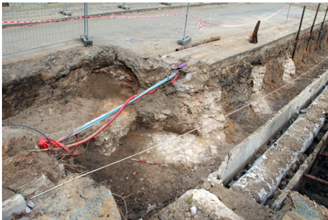
Obr. 50. Brno, ulice Lazaretní a Stará osada. Relikty zděných konstrukcí historické stavby v mírném ohybu Lazaretní ulice v úseku mezi Vojenskou nemocnicí a Zbrojovkou. Pohled od jihozápadu.