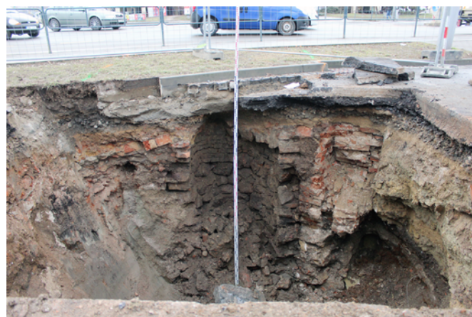
Obr. 46. Brno, Trnitá. Studna zachycená u křižovatky ulic Dornych a Úzká. Vpravo od ní základová zeď a zásyp Svrateckého náhonu. Foto Archaia Brno z. ú.

Fig. 45. Brno, Trnitá. Extent of the rescue excavation area. Archaia Brno z. ú.