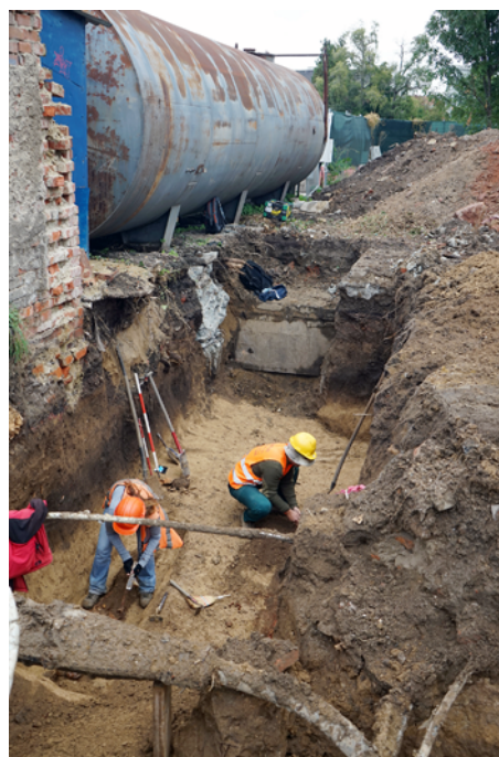
Obr. 44. Brno, ulice Vojtova (A060/2020). Pohled do výkopu na exkavaci hrobových jam.

Fig. 43. Brno, Vojtova Street (A017/2017). Excavation of one of the mass graves.