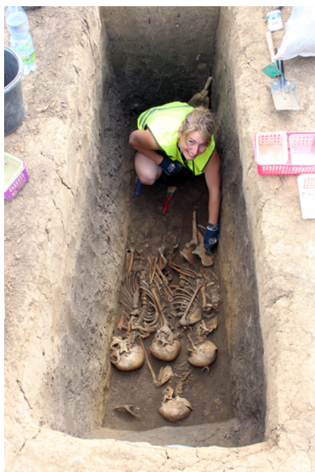
Obr. 43. Brno, ulice Vojtova (A017/2017). Preparace jednoho z hromadných hrobů.

Nouzový záchranný archeologický výzkum (akce A060/2020) byl vyvolán stavbou “Modernizace stávajících prostor haly SK TART Moravská Slavia Brno – přístavba a rekonstrukce” (Sedláčková 2021). Terénní výzkum související s přeložkou teplovodu proběhl ve dnech 29. 9. – 30. 9. 2020. Následovalo upozornění, že celá stavba se nachází v prostoru bývalého starobrněnského hřbitova a další zemní práce mohou tyto situace narušit. Vzhledem k plánovanému postupu při zakládání stavby však nebylo technicky možné provést záchranný archeologický výzkum tak, aby nedošlo ke zbytečnému narušení pietního místa hřbitova, ale také dalších archeologických terénů. Po jednání s příslušnými památkovými institucemi byl projekt založení stavby upraven tak, aby se minimalizovaly zásahy