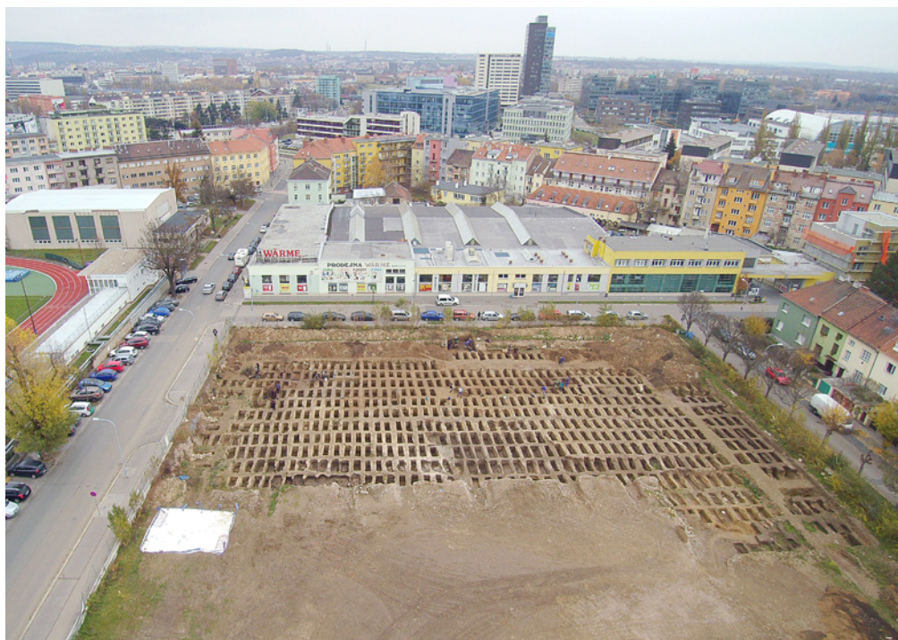
Obr. 42. Brno, ulice Vojtova (A017/2017). Celkový pohled na zkoumanou plochu hřbitova od západu.