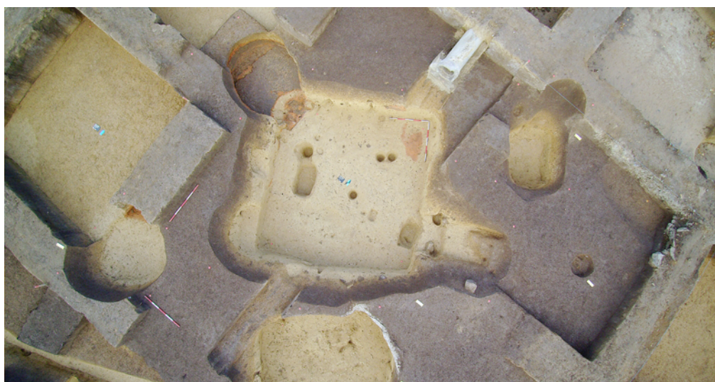
Obr. 41. Brno, ulice Vojtova (A017/2017). Ortofoto jednoho z raně středověkých suterénů se vstupní šíjí a do podloží tesanou pecí.

Nálezy hmotné kultury, zvláště keramika a případně železné předměty (např. ostruhy), zachycené osídlení datují do období 11. až 12. století. K přesnějšímu časovému zařazení přispívá rovněž 11 mincí. Větší část získaných exemplářů (8 ks) patří k moravským ražbám Konráda I. na Brněnsku (1061–1092). Dále byly po jednom exempláři získány ražby uherského krále Štěpána I.