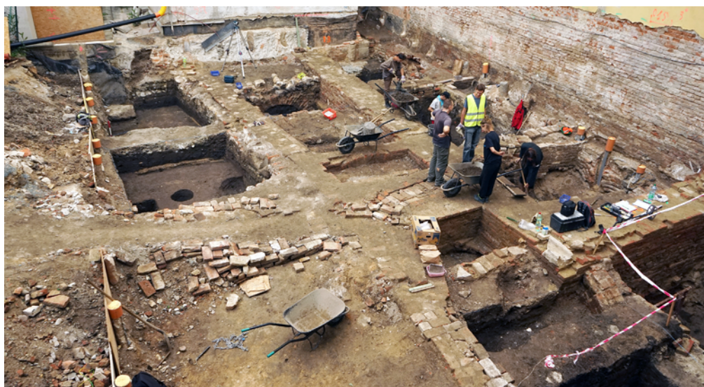
Obr. 27. Brno, ulice Orlí (A032/2020). Pracovní snímek – pohled na plochu výzkumu od jihu. Fig. 27. Brno, Orlí Street (A032/2020). Work photograph – a view of the excavation area from the south.

Sledované území se nachází v jihozápadní části historického jádra města Brna, na severovýchodním svahu Petrského návrší. Jedná se o prostor sevřený ulicemi Petrská, Petrov, bývalou ulicí Pod Horou sv. Petra a Uličkou Václava Havla. Výzkum byl situován do prostoru ohrazených zahrad mezi domy Petrov 1 a 2