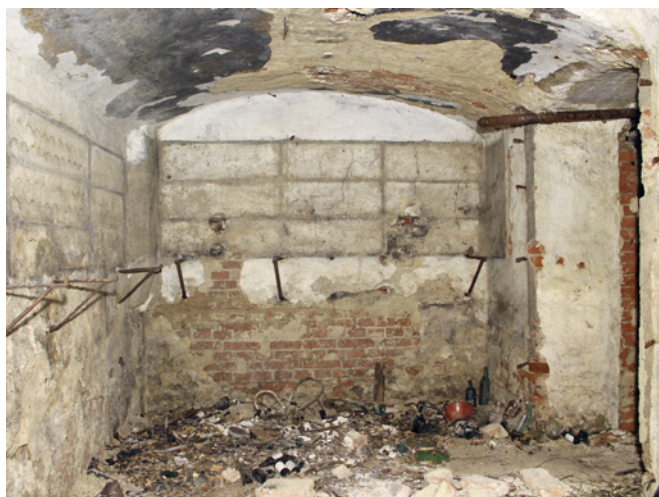
Obr. 24. Brno, Moravské náměstí. Ilustrační záběr zachovalých sklepních prostor Německého domu.