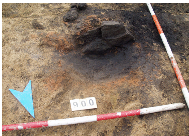
Obr. 17. Brno-Líšeň, ulice Houbařská. Jedna z hutnických pecí.

Fig. 17. Brno-Líšeň, Houbařská Street. One of the metallurgical furnaces.