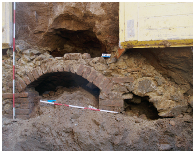
Obr. 10. Brno-Bosonohy. Relikty zděného sklepa (901) a vykopaná dutina (503).

Fig. 10. Brno-Bosonohy. Remnants of a masonry cellar (901) and an excavated cavity (503).