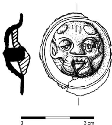
Obr. 13. Újezd u Černé Hory. Bronzová faléra. Kresba M. Novák.

dochován železný trn, kterým byla faléra připevněna na kožený řemen koňského postroje nebo přímo na vojákovu výstroj. Tyto faléry sloužily v římské armádě jako vyznamenání, a jejich objev nám poukazuje na možnou přítomnost římského vojska v daném území v poslední třetině 2. století (Antal 2017, 51–52; Zeman 2020, 192–193). Faléra ležela v hloubce 35–40 cm na výrazném návrší „Brlůžky“ (439 m n. m.) na k. ú. Újezdu u Černé Hory a jedná se o první publikovaný exemplář z Moravy. Nejblíže analogie najdeme v kvádské oblasti jihozápadního Slovenska.