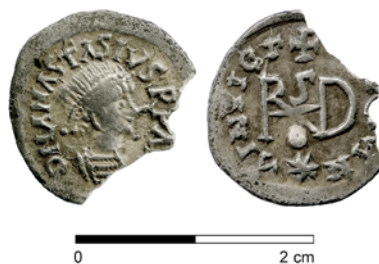
Obr. 11. Svinošice. Stříbrná mince (čtvrtsiliqua).