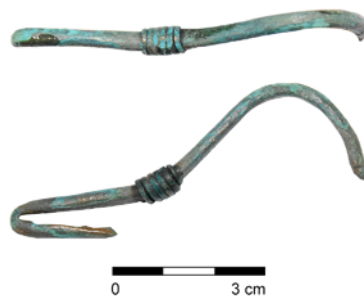
Obr. 7. Kozlov. Torzo bronzové spony s podvázanou nožkou z doby římské.

Ojedinelý nález spony s podvázanou nožkou na katastru obce Kozlova u Velkého Újezdu rozšiřuje sporadické stopy aktivit z doby římské na rozhraní Oderských vrchů a Tršické pahorkatiny, kudy mohla probíhat jedna z tras historické dálkové komunikace vedoucí z bečevské části Moravské brány směrem severozápadním do horního Pomoraví.