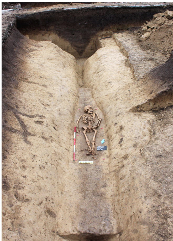
Obr. 5. Brno, Vojtova ulice. Pohled do částečně odkrytého příkopu krátkodobého tábora římské armády s kostrovým pohřbem s.j. 11856.