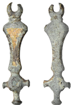
Obr. 26. Uhřičice. Bronzový závěsek zdobený emailem.

Z přerovského regionu pochází rovněž kromě exempláře z Uhřičic tvarově téměř shodný křížovitý závěsek nalezený v roce 2020 na katastru obce Horní Moštěnice (viz výše Horní Moštěnice, okr. Přerov). Za analogický lze označit také křížovitý závěsek původně zdobený emailem z lokality Chornice 2c v Boskovické brázdě (Vích 2017, 636, 651, obr. 4: 9). Značnou podobnost vykazuje rovněž exemplář křížovitěho závěsku z lokality Staré Zámky v Brně-Líšni (Čižmářová 2012, 192, tab. I: 2). Jako tvarově vzdálenější paralely lze uvést nálezy závěsků z laténské lokality na katastru obce Klenovice na Hané (Čižmář et al. 2008, 126–127, obr. 2: 6) či lokality Těšice (Čižmář et al. 2010, 129, 131, obr. 5: 7).