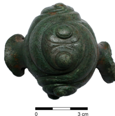
Obr. 17. Mořice. Fragment nánožníku zdobeného plastickým ornamentem.