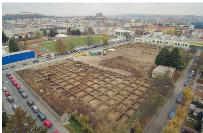
Obr. 3. Brno, Vojtova ulice. Celkový pohled na plochu výzkumu od jihozápadu.

Postup předstihového záchranného archeologického výzkumu mohl být koncipován na základě informací získaných zjišťovacím archeologickým výzkumem provedeným v roce 2014 (Kolařík 2014) a podrobnou historicko-archeologickou rešerší