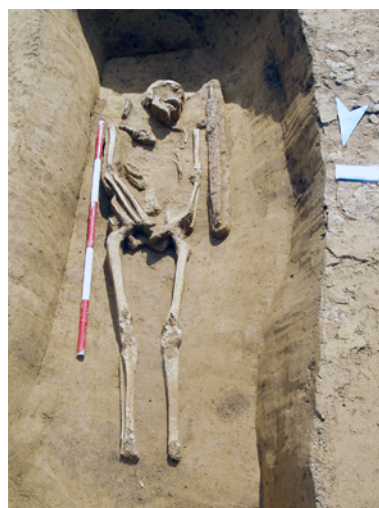
Obr. 1. Brno-Horní Heršpice (okr. Brno-město). Pohřeb bojovníka s mečem.

V prosinci výzkum pokračoval v místě budoucí retenční nádrže, nacházející se na opačné ploše stavby při Kšírově ulici. Během této části výzkumu zde bylo odkryto sídliště horákovské kultury, v jednom ze sídlištních objektů se podařilo vyzvednout tři tkalcovská závaží.