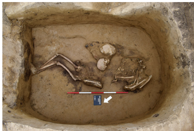
Obr. 24. Malešovice. Vykradený kostrový hrob únětické kultury.