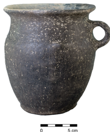
Obr. 23. Malešovice. Keramická nádoba pocházející ze zásobní jámy únětické kultury.

Zatím nedatovaný je skelet středně velkého psa zachycený před výkopem vlastního hrobu na rozhraní podorničí a podloží v půdorysu hrobové jámy. Může jít o obětinu související s pohřbem ze starší doby bronzové, s ohledem na přilehlé objekty z raně středověkého období je však možné uvažovat i o chronologickém zařazení do této fáze osídlení lokality, a vezmeme-li v potaz jen 1,5 m vzdálenou krajnici dnešní vozovky, nelze vyloučit ani recentní datování skeletu.