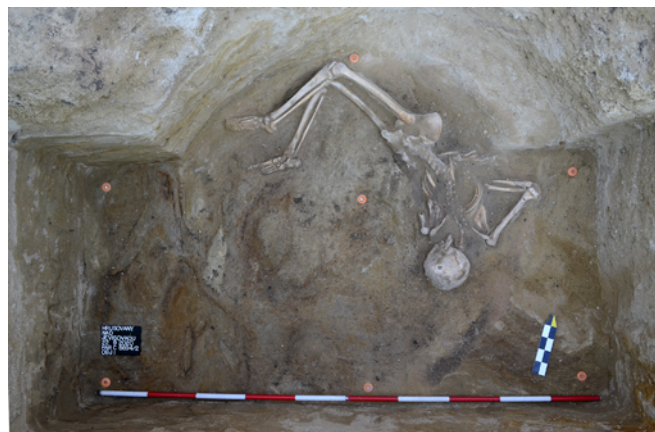
Obr. 14. Hrušovany nad Jevišovkou. Lidský jedinec na dně objektu č. 1.

Při archeologickém terénním výzkumu vyvolaným stavbou „Odvedení dešťových vod z komunikace pod ul. Drnholecká“ v Hrušovanech nad Jevišovkou byly během měsíce září 2020 odkryty dvě antropogenní struktury.