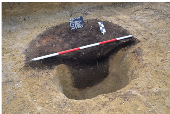
Obr. 15. Hrušovany nad Jevišovkou. Objekt č. 2.