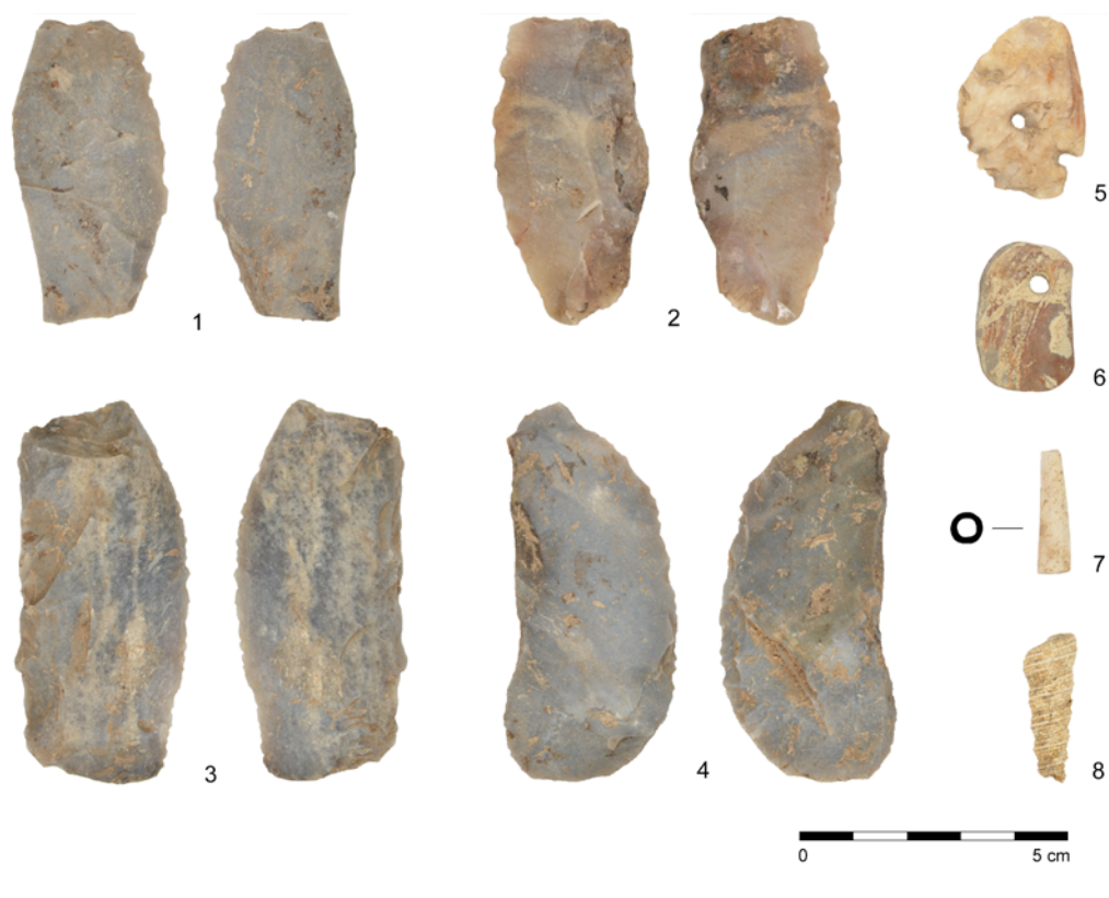
Fig. 15. Hrušovany nad Jevišovkou. Feature No. 2.