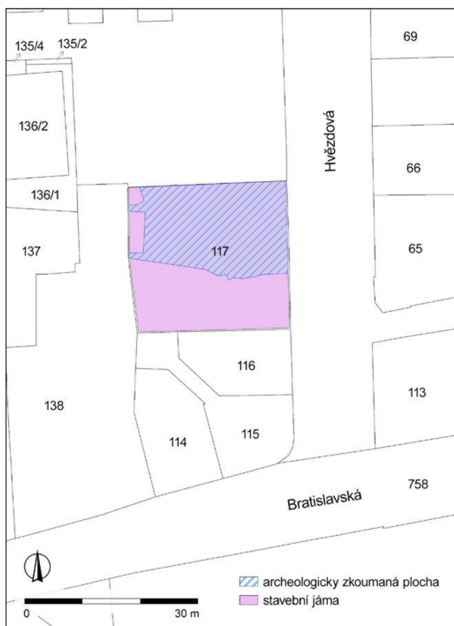
Obr. 5. Brno, ul. Hvězdová. Lokalizace výzkumu A059/2020 s vyznačením archeologicky zkoumané části stavby. Archaia Brno z. ú.

Obrisy s.j. 506 nebyly ve výplni s.j. 507 patrné, proto byly zprvu exkavovány najednou. Přítomnost lidského skeletu tedy byla překvapením, odhaleným až ve chvíli, kdy naostřený rýč neúprosně projel lebkou a rozdrtil křehkou schránku lidské mysli na desítky kusů. Určování původních rysů pochovaného se tímto