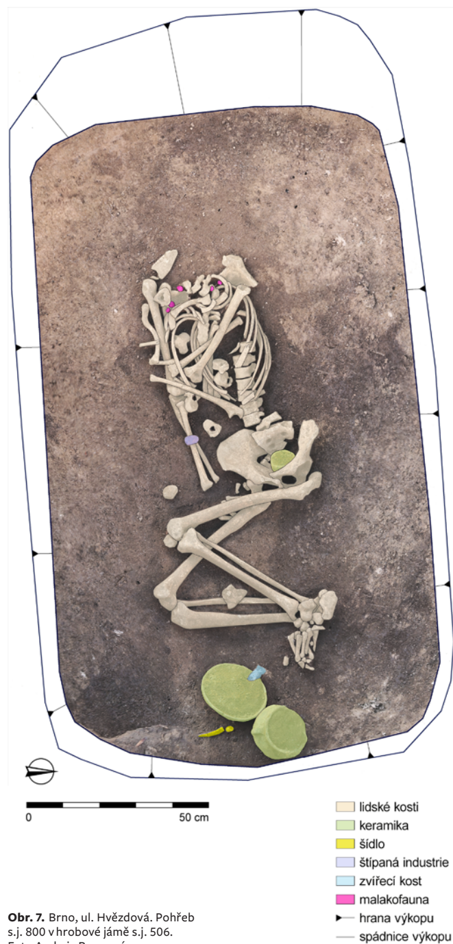
Obr. 7. Brno, ul. Hvězdová. Pohřeb s.j. 800 v hrobové jámě s.j. 506. Fig. 7. Brno, Hvězdová Street. Burial s.u. 800 in burial pit s.u. 506.