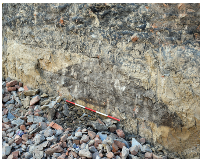
Obr. 9. Brno, ul. Vranovská. Zbytky zásobní jámy z doby bronzové u přilehlé zdi sousedního domu.

Stavební činnost nebyla včas ohlášena, a tak byl archeologický dohled při stavbě nového polyfunkčního domu proveden, až když byla plocha staveniště snížena o cca 1 m od úrovně uliční čáry. Větší část parcely byla ale již dříve porušena starší výstavbou. Na profilu stavební jámy, u zdi k domu č. 920/5, však byly zjištěny zbytky sprašového podloží přiléhající ke zdi sousedního domu. Ve vertikálně umístěném torzu spraše silném pouze 1–3 cm byl zdokumentován profil zásobní jámy, z níž byl získán nepočetný materiál, který je možné datovat rámcově do doby bronzové (obr. 9).