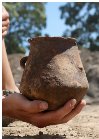
Obr. 4. Brno, ul. Nové Sady. Keramiká únětické kultury.

Na polykulturní lokalitě bylo mimo jiné doloženo osídlení i z doby bronzové. Jeden z objektů patří do staršího stupně kultury únětické (obr. 4) a během skrývky byl objeven objekt se dvěma nádobami z období popelnicových polí. Posledním zatím identifikovaným reliktem s keramikou doby bronzové je mělký neckovitý příkop na hranici sprašové návěje a nivy, zaniklý pravděpodobně zaplavením. Kromě osídlení z doby bronzové se na lokalitě podařilo doložit i kulturu s lineární keramikou, kulturu s moravskou malovanou keramikou a osídlení ze středověku až novověku.