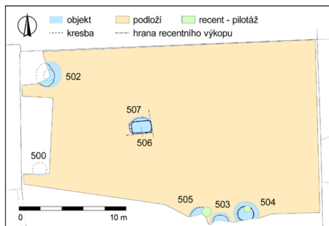
Obr. 6. Brno, ul. Hvězdová. Situace na archeologicky zkoumané ploše výzkumu A059/2020. Archaia Brno z. ú.