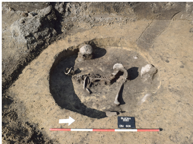
Obr. 1. Blučina. Skelet ženy ve skrčené poloze na dně sídlištní jámy. Fig. 1. Blučina. Female skeleton in a flexed position at the bottom of the settlement pit.

Protože se většina stavebních prací odehrávala v již nasypaném recentním terénu, byl archeologický výzkum zaměřen zejména na dohledy nad výkopy pro inženýrské sítě. Především se jednalo o kanalizaci, která probíhala severojižním směrem ve východní části staveniště, následně se stáčela na západ a napojila do prostoru vlastní haly. Při plošném odkryvu v této trase bylo zachyceno celkem 27 objektů, z nichž většinu lze zařadit do starší nebo mladší doby bronzové, případně jen obecně do doby bronzové. Často šlo o kruhové sídlištní nebo zásobní jámy, v jedné z nich pak byl uložen skelet asi dvacetileté ženy ve skrčené poloze (obr. 1). Materiál z tohoto objektu bohužel umožňuje dataci pouze rámcově do doby bronzové. Po celou dobu výzkumu byla také sledována kulturní vrstva dosahující mocnosti cca 0,5 m, při jejímž postupném snižování stavební mechanizací bylo kromě ojedinělých zlomků keramiky objeveno několik částí nádob vsazených do sebe, které je možné datovat do mladší doby bronzové.