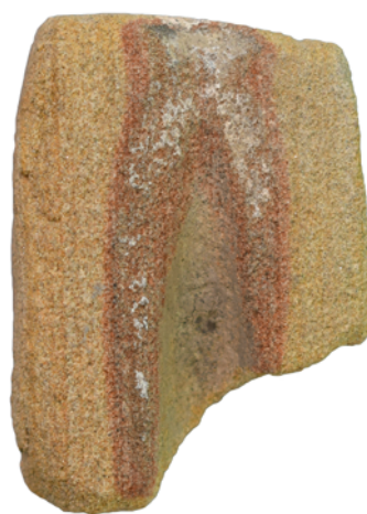
Obr. 3. Branišovice. Zlomek kamenného kadlubu ze zásobní jámy věteřovské skupiny.

Záchranný archeologický výzkum probíhal při rekonstrukci vodovodního potrubí na mírném návrší v jihozápadní části Branišovic, mimo jiné v okolí místního zámku. Na tomto místě bylo již dříve dokumentováno osídlení věteřovské skupiny v souvislosti s výstavbou nové kanalizace (Čižmář 2016, 203). Stavba vodovodu probíhala paralelně s výkopy pro kanalizaci, v některých úsecích se dokonce s nimi i křížila. I tentokrát byly výkopem porušovány četné objekty, mimo jiné také zásobní jámy ze starší doby bronzové (věteřovská skupina) a nově také z mladší doby bronzové. Některé objekty poskytly bohatší keramický inventář, jedna z věteřovských jam vydala také v našem prostředí zatím neobvyklý nález kamenného kadlubu (obr. 3).