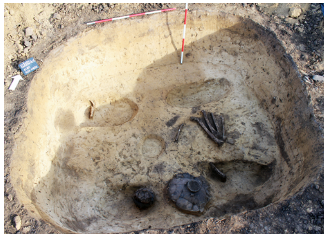
Obr. 21. Vyškov-Dědice. Vyloupený hrob kultury se šňůrovou keramikou.

Zkoumaná plocha se nachází mezi účelovou komunikací a tzv. vojenskou železniční vlečkou, na okraji průmyslového areálu, poblíž severozápadního okraje intravilánu Vyškova, na hranici katastrů Vyškova a Dědic u Vyškova. Jedná se o mírné návrší s jižní expozicí. Nejbližším vodním zdrojem je Marchanický potok protékající zhruba 900 m severovýchodně od zkoumané plochy.