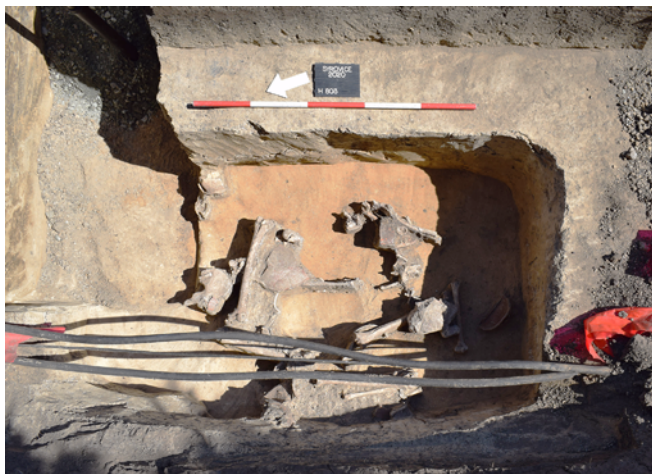
Obr. 19. Syrovice. Vykradený mužský kostrový hrob kultury zvoncovitých pohárů. Foto I. Čižmář.

V roce 2020 byly v rámci již několik let probíhající stavby inženýrských sítí pro výstavbu nových rodinných domů prováděny výkopy pro pokládku vodovodu a nízké napětí. Při kontrole výkopů byly v západní části stavby zaznamenány celkem dva kostrové hroby, které byly prozkoumány plošně. V prvním hrobě orientovaném ve směru JZ-SV byla pohřbena žena ve skrčené poloze bez milodarů. Další hrob, který byl orientovaný přibližně ve směru S-J a náležel muži v kategorii starší juvenis, byl vykradený a žádná z nalezených kostí již neležela v anatomické poloze (obr. 19). Byly zde však nalezeny fragmenty mísy, které je možné přiřadit ke kultuře zvoncovitých pohárů. Na základě tohoto nálezu je také možné přehodnotit dřívější datování dosavadních