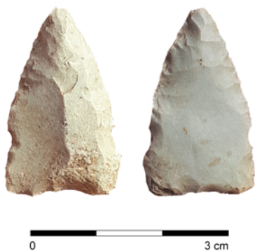
Obr. 17. Přerov. Silicitová šipka.

Nalezenou keramiku lze prozatím pouze rámcově datovat do období eneolitu. Hrot šipky má následující rozměry: délka 30 mm, šířka 18,5 mm a tloušťka 6 mm. Hmotnost šipky činí 3,233 g. Šipka je zhotovena z lokálního rohovce světle šedého zabarvení. V případě přerovského exempláře jsou na bocích dva méně výrazné vruby při bázi nástroje. Šipku lze zařadit k tzv. hrotům typu Štramberg – Krnov, které se v nápadně velkém množství vyskytují především na lokalitách severovýchodní Moravy (Hladké Životice, Kopřivnice, Příbor, Pustějov, Štramberg) a jsou spojovány s pozdně lengyelským osídlením, případně s kulturou nálevkovitých pohárů (Fryč 2018, 153–154). Na území přerovského regionu byly hroty typu Štramberg – Krnov nalezeny například na katastru obcí Sušice u Přerova, Veselíčko u Lipníka nad Bečvou či přerovské místní části Žeravice (Diviš 2004, 18, obr. 3: 1; Schenk 2006, 136; 2012, 153).