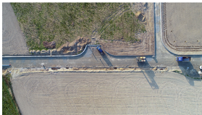
Obr. 16. Otice. Pohled na výzkum z ptačí perspektivy (snímek pořízen pozemním vrtulníkem DJI PHANTOM 4 PRO+).

V dubnu roku 2020 proběhl na katastru Otice (místní část Rybníčky) záchraný archeologický výzkum, který se uskutečnil v rámci rozšíření komunikace a výstavby kanalizační sítě. Výzkum navazoval na záchranou akci z roku 2019 (Juchelka et al. 2020, 161). Celkem bylo v roce 2020 zachyceno 5 zahloubených objektů, z nichž čtyři navazovaly na situace z roku 2019 a jeden představoval nově zkoumanou situaci (obr. 16). Nalezeny zde byly doklady aktivity lidu hornoslezské lengyelské skupiny v období její IV. fáze. Nálezy opět potvrzují, že místo a současně i jeho širší okolí bylo v minulosti, především v období staršího eneolitu, velmi intenzivně osídleno.