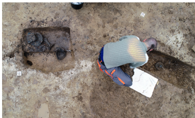
Obr. 14. Neplachovice. Preparace hrobů mladší fáze hornoslezské skupiny lengyelské kultury.