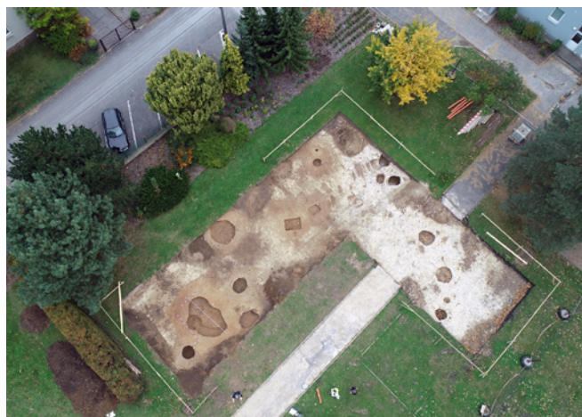
Obr. 13. Neplachovice. Pohled na výzkum z ptačí perspektivy (snímek pořízen pozemním vrtulníkem DJI PHANTOM 4 PRO+).