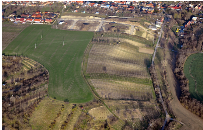
Obr. 20. Starovice. Letecký pohled na lokalitu od západu. Fig. 20. Starovice. Aerial photo of the site, view from the west.

řadu dalších situací, které doplní mozaiku pravěkého využívání lokality. V tuto chvíli je však možné konstatovat, že se podařilo prozkoumat značnou část sídliště, zatím bez dokladů funerálních aktivit. Sídliště bylo využíváno především v období mladšího stupně lengyelské kultury a v období věteřovské kultury starší doby bronzové (viz oddíl Doba bronzová).