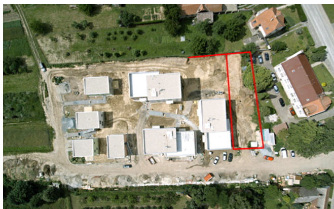
Obr. 10. Buchlovice. Letecký pohled na zkoumanou plochu.