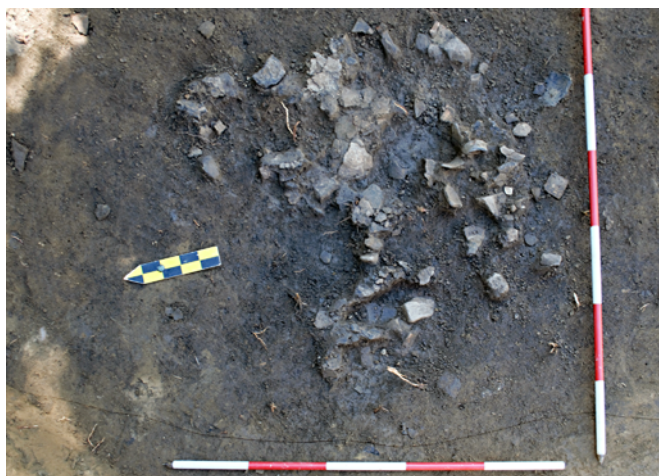
Obr. 11. Buchlovice. Pohled na kumulaci střepů ve stavební jámě.