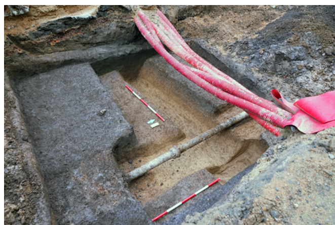
Obr. 6. Brno, ul. Grmelova. Pohled na příkop od jihovýchodu. Fig. 6. Brno, Grmelova Street. View of the ditch from the south-east.

Na základě terénní situace však musel být výkop původně hluboký minimálně 1,2 m a široký minimálně 1 m. Výkop byl vyplněn středně hnědou, plastickou hlínou s drobnými hrudkami mazanice a uhlíky (s.j. 124=143). Při dně výkopu byla výplň již silně promísená žlutou plastickou hlínou (s.j. 125=145), pravděpodobně ze stěn výkopu při jeho zanašení (obr. 6). Z výplně příkopu bylo získáno jen šest drobných střepů, které lze předběžně zařadit do období kultury s lineární keramikou (Sedláčková, Šimík 2020). Zda i zjištěný příkop náleží této kultuře, zůstává otázkou. Hypoteticky bychom tuto aktivitu mohli spojit s nedávno zachyceným sídlištěm kultury s lineární keramikou, které se nachází jen několik metrů severním směrem v prostoru nově vybudovaných bytových domů při ulici Vojtově (Grünseisen et al. 2020).