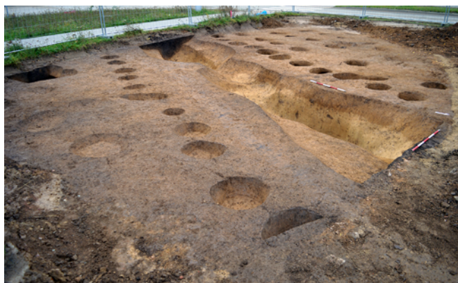
Obr. 3. Brno – Starý Lískovec. Pohled na reliktu dvou dlouhých domů.

V říjnu a listopadu roku 2020 uskutečnili pracovníci Ústavu archeologické památkové péče Brno, v. v. i, záchranný archeologický výzkum na parc. č. 1681/119 a 1681/178 v souvislosti s výstavbou tramvajové tratě do Univerzitního kampusu Bohunice. Dotčené pozemky se nachází v severní části katastrálního území, kde přiléhají k východní straně jižní třetiny ulice Netroufalky. Výkopy pro přeložku vodovodu a terénní úpravy prostoru budoucí konečné nové tramvajové tratě před Fakultní nemocnicí Brno odkryly úseky dosud neporušeného terénu s celkem 68 zahloubenými sídlištními objekty. Podle získaného materiálu, především zlomků keramických nádob, představují tyto objekty pokračování známé osady kultury s lineární keramikou, která byla z větší části odkryta již při výstavbě sousedního nákupního centra Campus Square a navazujících administrativních budov Campus Science Park (naposledy Přichystal 2018, 124). Mezi objevenými objekty převažovaly křivé jámy, v nichž byla původně ukotvena nosná konstrukce charakteristických dlouhých domů obdélníkového půdorysu. Rozpoznány byly části dvou takových domů, oddělených od sebe navzájem stavebními jámami (obr. 3). Delší dům měl jeden konec zpevněn základovým žlabem a dosahoval šířky 5,5 m a délky nejméně 22 m. V okolí pak bylo prozkoumáno ještě několik blíže neinterpretovatelných sídlištních jam a jedna zásobní jáma.