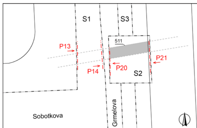
Obr. 5. Brno, ul. Grmelova. Průběh příkopu a zdokumentované profily. Archaia Brno z. ú.