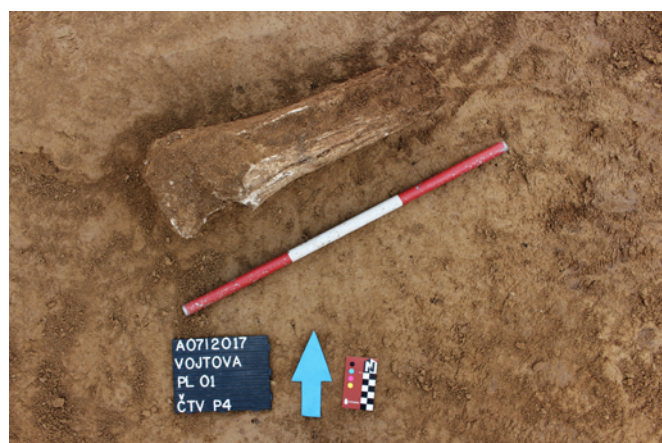
Obr. 6. Brno, Vojtova ulice. Detailní pohled na tibii mamuta srstnatého.