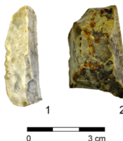
Obr. 1. Bílovice. Čepel a úštěp. Fig. 1. Bílovice. A blade and a flake.