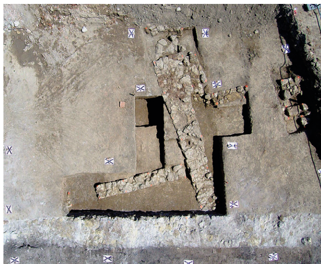
Obr. 98. Židlochovice, Palackého. Letecký pohled na zkoumanou plochu s pozůstatky kamenných zdí.

Abb. 98. Židlochovice, Palackého-Straße. Luftaufnahme der Grabungsfläche mit Überresten der untersuchten Mauern.