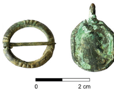
Obr. 95. Vladislav, kostel Nejsvětější Trojice. Středověká kruhová přezka a novověká svátostka z výkopů na někdejší hřbitově u kostela.

Fig. 95. Medieval round buckle and modern religious medal found in a trench in the church cemetery.