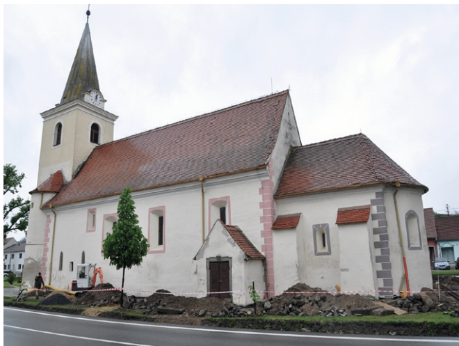
Obr. 93. Kostel Nejsvětější Trojice ve Vladislavi od jihu.

Raný středověk, vrcholný středověk, novověk. Kultovní areál. Záchranný výzkum.