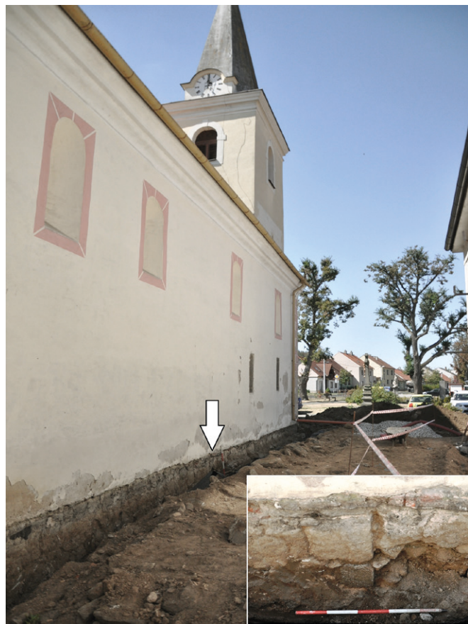
Fig. 93. Holy Trinity Church at Vladislav from the south.

Archeologický výzkum byl vyvolaný odvlhčením a rekonstrukcí dešťové kanalizace kostela Nejsvětější Trojice (Těsnohlídek 2019). Zemní práce odhalily základové zdivo, dobře patrná byla stavební spára oddělující starší a mladší fázi pozdně románského kostela (obr. 93–94). Výkopy v prostoru hřbitova obsahovaly fragmentární osteologický materiál, svátostku, několik zlomků keramiky a četné slitky zvonoviny (obr. 95–96).