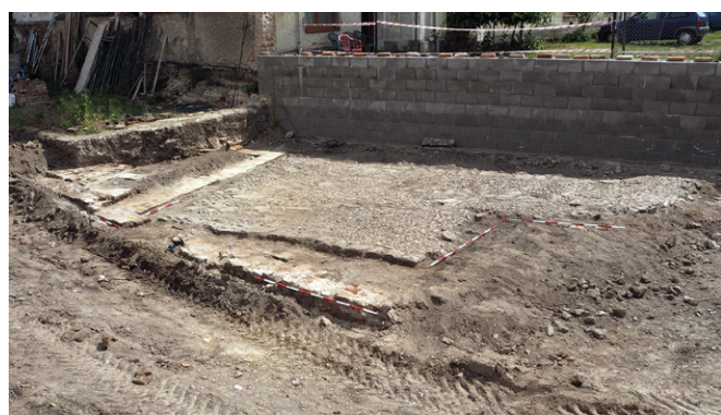
Obr. 91. Valtice, náměstí Svobody 19. Pozůstatky koňské stáje s valounovou dlažbou a žlabem v popředí.