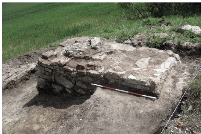
Obr. 80. Šatov. Severovýchodní pilíř šibenice.