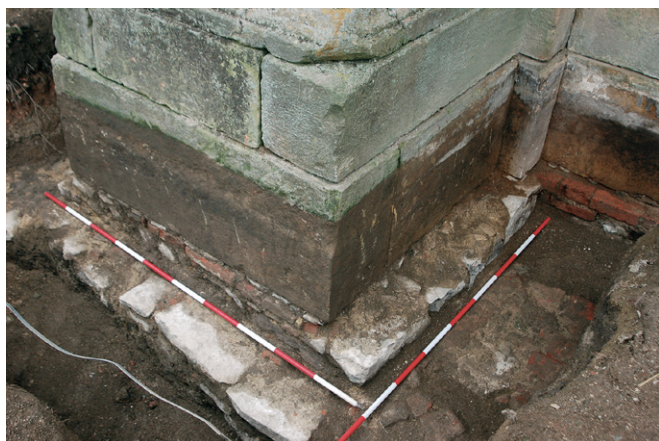
Obr. 74. Plumlov (okr. Prostějov), nádvoří zámku. Struktura základového zdiva pilíře při vnitřní obvodové stěně objektu.