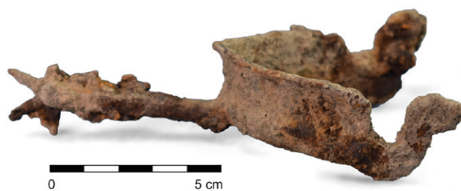
Obr. 73. Mokrý-Horákov. Ostruha z 2. poloviny 15. století nalezená pomocí detektoru kovů.

Díky detektorové prospekci se podařilo řadu lesních cest zařadit hluboko do minulosti a některé z nich dokonce spojit s obslužnými aktivitami vrcholné středověkých vápeníků.