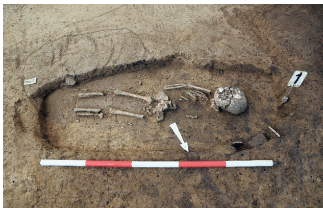
Obr. 72. Modrá u Velehradu 2019. Hrob H1/2019.

Druhá etapa předstihového archeologického výzkumu by měla proběhnout v roce 2020.