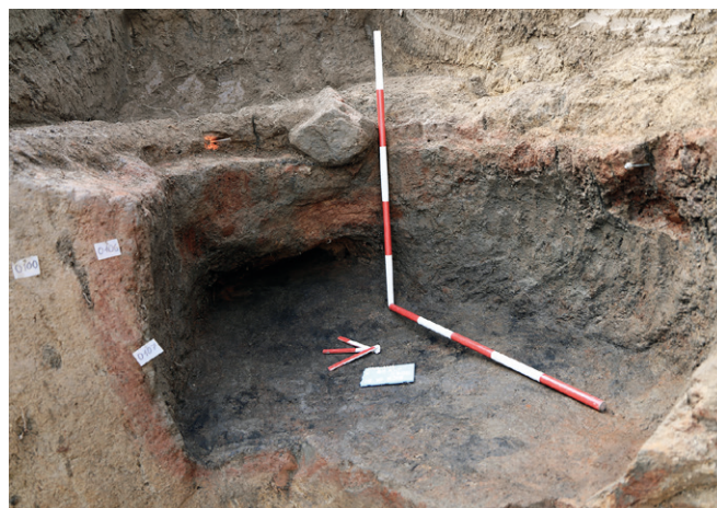
Obr. 54. Jihlava, ulice U Skály. Pohled na hrnčířskou pec po ukončení preparace.

Těsnohlídek, J., Kochan, Š. 2019: Jihlava, Bytový dům U Skály . Rkp. nálezové zprávy č. A091/2016. Uloženo: Archiv Archaia Brno z. ú.