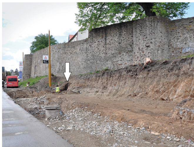
Obr. 50. Jihlava, Hradební ulice, středověké městské opevnění se sondou v příkopu.

Při rozšiřování vozovky v Hradební ulici byl zemními pracemi zasažen JV bastion, tvořící součást jihlavské městské pevnosti. Její základy tvoří středověká hradba o obvodu 2140 m, vybavená 5 bránami a 8 věžemi a později doplněná parkánovou hradbou (Semotamová ed. 2000). Při výzkumu byl zdokumentován řez středověkým hradebním příkopem, vytesaným do rostlé skály (obr. 50–52). Díky archeobotanické analýze sedimentu z jeho dna můžeme pro období středověku interpretovat bezprostřední okolí jako mozaiku polí, pravděpodobně i zahrádek, pastvin a druhově bohatých luk, nejpravděpodobněji suchých trávníků, bez výrazného vlivu pastevectví (Petr 2019). Situaci nedoprovázely žádné datovatelné nálezy, nicméně příkop byl zasypán v období 16.–17. století, při budování velkého jihovýchodního bastionu (Těsnohlídek 2019).