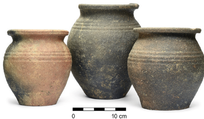
Obr. 55. Jihlava, ulice U Skály. Příkladky hrnců ze vsádky pece, 13.–14. století.