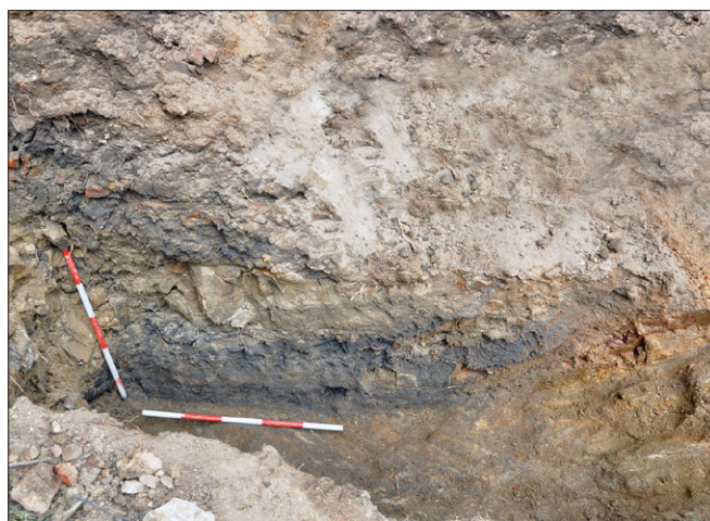
Fig. 50. Jihlava, Hradební Street, medieval city walls with the test pit in the ditch.