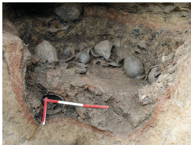
Obr. 53. Jihlava, ulice U Skály. Snímek středověké hrnčířské pece s částí vsádky.

Archeologický výzkum byl vyvolán stavbou bytového domu. Při hloubení stavební jámy byl zachycen areál hrnčířské dílny z 2. poloviny 13. či začátku 14. století, který se nacházel na hraně terénní terasy nad řekou Jihlavou, cca 300 m od centra staré Jihlavy a kostela sv. Jana Křtitele (Těsnohlídek, Kochan 2019). V západním rohu výkopu byla zachycena jednokomorová hrnčířská pec s dochovanou vsádkou keramických nádob. Pec byla zahlobena do písčitého podloží (obr. 53–54). Vnitřek pece byl vymazán tenkou vrstvou šedého vypáleného jílu, ve kterém byly ojediněle nalepeny keramické střepty. Dno o rozměrech 124 × 118 cm se svažovalo směrem k topnému otvoru. Ten měl podobu úzkého oválného kanálu, který byl ode dna pece oddělen drobným odskokem. Topeniště se nacházelo mimo zábor stavby a nebylo ho možné prozkoumat. Pec lze považovat konstrukčně za velice blízkou peci z Kostelce nad Jihlavou a určit ji jako jednoprostorovou pec s vertikálním až diagonálním tahem plamene. Podobný typ, lidově označovaný jako ležatý, byl používán ve slovenských Pozdišovcích ještě v 18. století (Meduna 1954; Čapek et al. 2018; Plicková 1959).